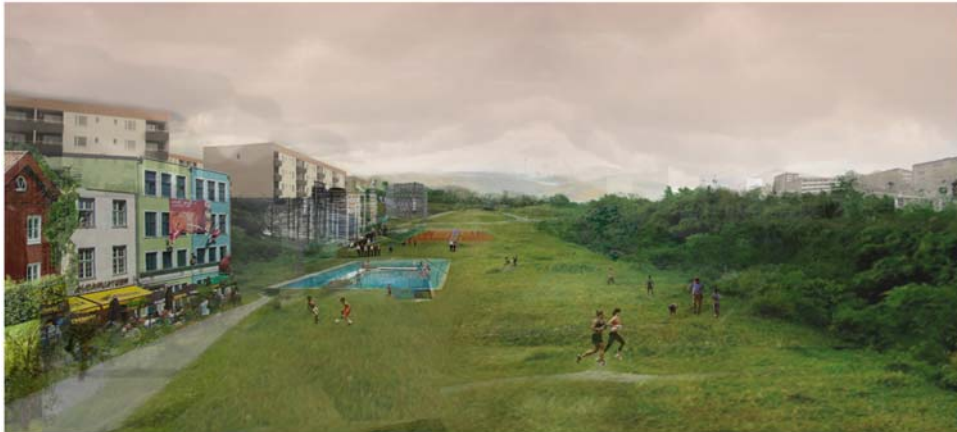
Illustration ur förslaget Delta-X, ett park- och slystråk som sträcker sig genom området.

Arbetet med Norra Vrinnevi kan ses om en del i ett slags paradigmskifte där ambitionen är att ta tillbaka 60- och 70-talens överblivna ytor. Det finns också en stor utmaning i att kombinera det småskaliga med den storskaliga utvecklingen. Exempel på storskaliga förändringar som kan bli aktuella inom Norra Vrinnevi är utbyggnaden av spårvägen till Vrinnevisjukhuset samt en framtida expansion av sjukhuset. Sjukhuset är en mycket stor arbetsplats och målpunkt för många medborgare. Det är därför av stor vikt att planeringen för området tar stor hänsyn till utvecklingen av sjukhusets verksamheter.